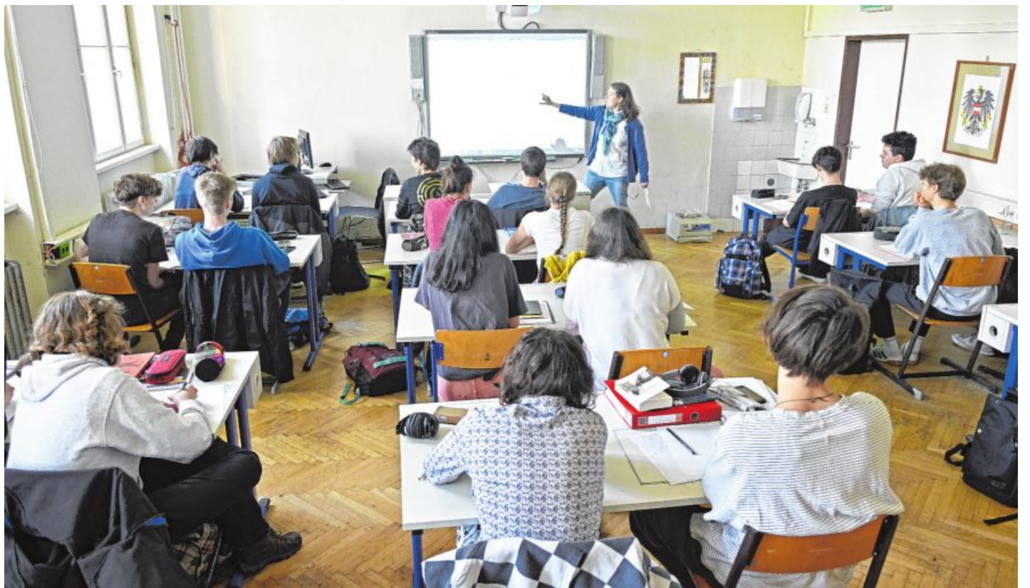
Welchen Quellen kann ich vertrauen, welchen nicht? Bildungsminister Martin Polaschek schickt Wissenschaftsbotschafter an die Schulen.