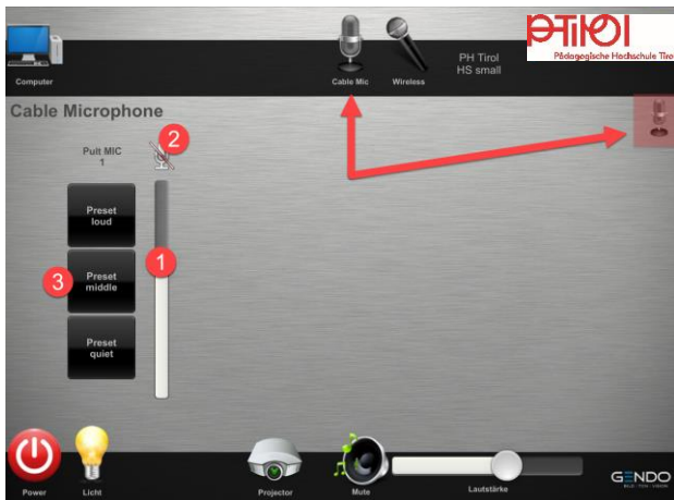
Kabelgebundenes ‚Pult Mikrofon‘