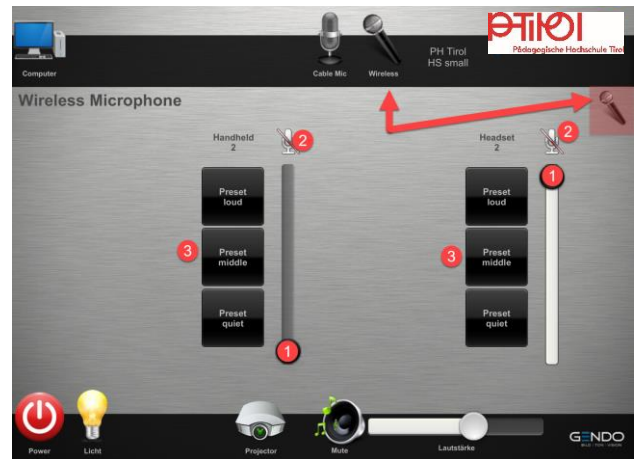
Kabelloses Mikrofon | Headset