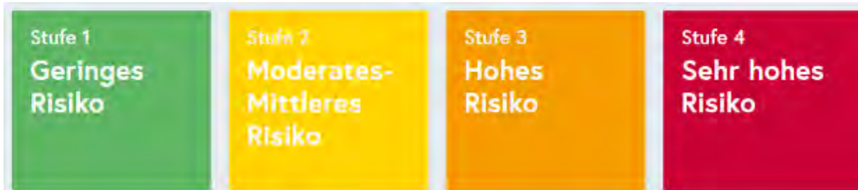
Abb. 1: Ampelsystem der Bundesregierung (vgl. COVID-19-Leitfaden des BMBWF, S. 31.)